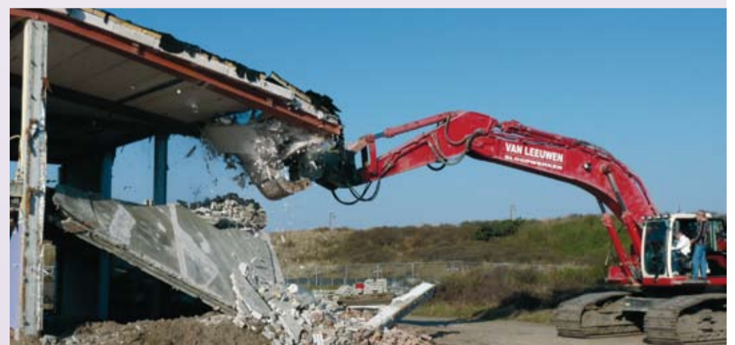
Pas op de plaats nieuwbouw.

Wat betreft de nieuwbouwplannen op het Hafakkerterrein in Noordwijkerhout was het in