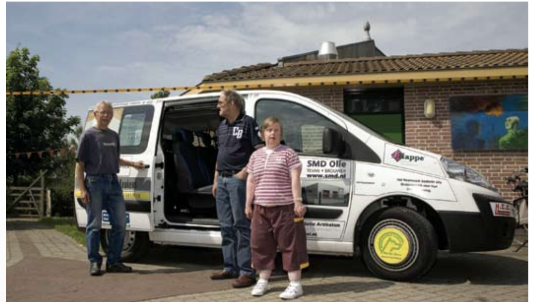
Vrijwilligers tevreden over relatie met Het Raamwerk.

duurzaam klimaat binnen de organisatie. Medewerkers bedenken acties die variëren van het inkopen van duurzame energie en koffie tot het verduurzamen van afvalstroom. Het project loopt tot oktober 2010.