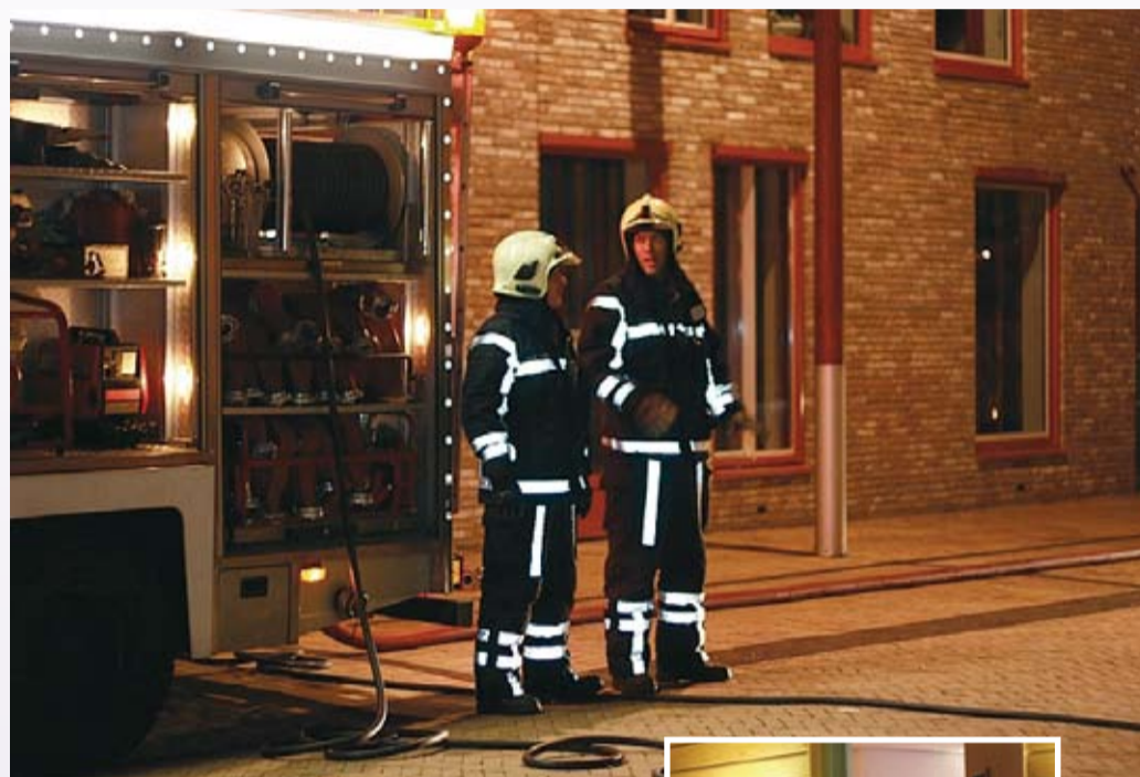
Brandweeroefening locatie Zeehos.

Op locatie Zeehos in Katwijk zijn enkele oefeningen gezamenlijk met de Katwijkse brandweer gehouden. Die zijn door het aanwezige personeel en de brandweer als nuttig ervaren. Daarnaast konden alle medewerkers van Het Raamwerk oefenen met kleine blusmiddelen, zodat zij een kleine beginnende brand zelf kunnen blussen. Aan het eind van het jaar is het BHV-beleid geëvalueerd.