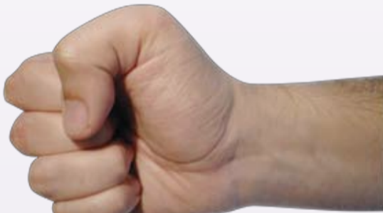
Incidenten met agressie.

In 2009 is het belang van registratie van (bijna) incidenten binnen de organisatie uitgebreid aan de orde geweest. Het is dan ook mogelijk dat het aantal meldingen juist gestegen is door het nu op correcte wijze uitvoeren van het beleid.