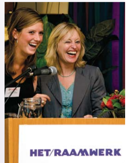
200 e leerafdeling geopend.

In 2005 is de leerafdeling in het middelbaar beroepsonderwijs geïntroduceerd door Calibris, het kenniscentrum voor leren in de praktijk in Zorg, Welzijn en Sport. Het is een succesvol concept gebleken. Leerafdelingen bieden niet alleen kwalitatief goede stageplekken, maar ook kwantitatief veel stageplaatsen per instelling. De leerafdeling doet een extra beroep op de zelfstandigheid en verantwoordelijkheid van de leerlingen. Ze vinden in de praktijk al doende antwoord op hun eigen leervragen. Het ROC en Het Raamwerk zorgen samen voor de begeleiding van de leerlingen. Calibris faciliteert de opzet van de leerafdeling met financiële ondersteuning, producten, trainingen en adviezen.