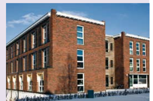
Gebouw met een bijzondere functie.

Op 15 december zijn de eerste cliënten naar de nieuwe appartementen verhuisd.