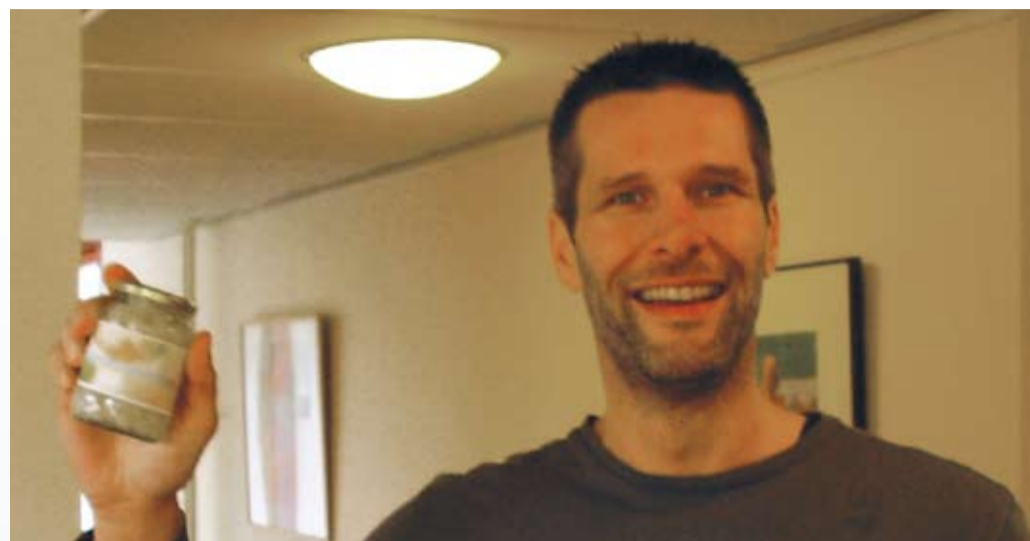
De winnaars werden op 1 april bekendgemaakt en kregen allemaal een 'personeelsuitje', een pot zilveruitjes.

Bij RVE De Hafakker waren de scores gemiddeld 6.5; bij RVE Regio 6.4. en bij RVE Het Zeehos 6.1.