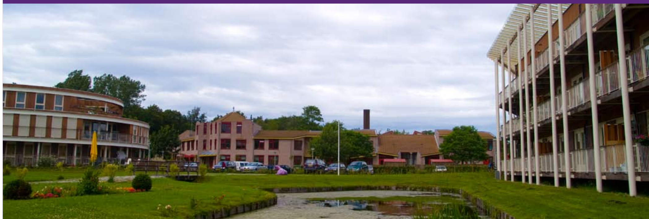
De Hafakker in Noordwijkerhout.