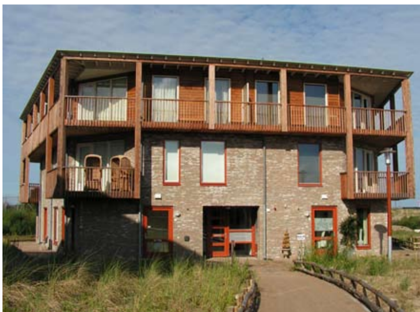
Prachtige nieuwe appartementen.

Medio mei 2009 zijn weer cliënten vanuit de oude woongebouwen en de tijdelijke huisvesting verhuisd naar de nieuwbouw in de Zeehoswijk. Zij zijn overgegaan naar hun prachtige nieuwe appartementen in Korfschelp, Tolhoren, Penhoren en Fuikhoren.